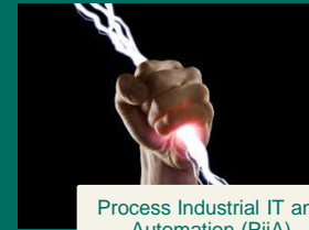
Process Industrial IT and Automation (PiiA)