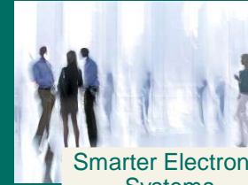
Smarter Electronic Systems