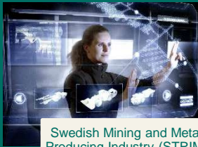
Swedish Mining and Metal Producing Industry (STRIM)