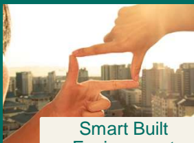
Smart Built Environment