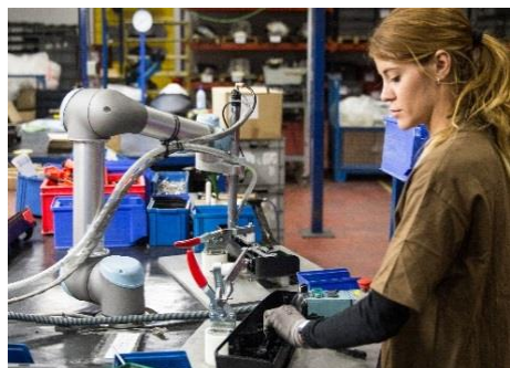
AH Automation visar en robot från Universal Robotics.