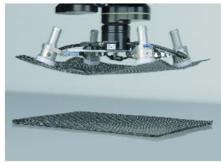
Schunk visar hanteringsprodukter för komposit.