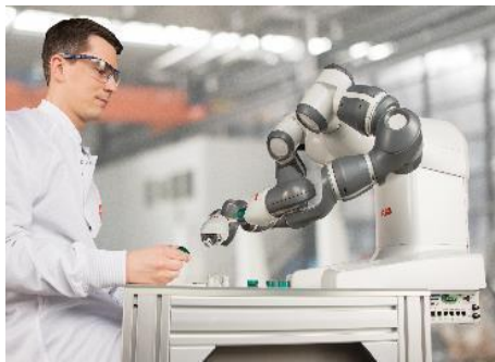
ABB visar sin världsnyhet Yumi.